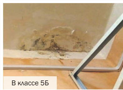
В классе 5Б

почти в три раза, действительно, как признаёт её руководство, уже много лет работает без ремонта. Если первый и второй этажи, где проходят публичные мероприятия, и особенно выборы, ещё более-менее в порядке, на третьем, куда редко заходит начальство и не добираются посторонние, почти разруха. Это при том, что на систему образования из районного бюджета из года в год выделяется более 80% всех средств, а это порядка 8 млрд. руб. Но гореловские школы, нуждающиеся в особом отношении из-за переполненности и работы на локальных территориях, обеспечиваются почему-то по остаточному принципу. Правда, в последние пять лет их немного выручали депутаты городского ЗакСа через свои поправки, благодаря чему в 391-й школе, наконец, отремонтировали спортивный зал и заменили окна, а в 398-й, что в Ториках, сделали хороший пищеблок. Однако наши школы при таком раскладе всё время находились в позе попрошайек, ведь они получали положенные им деньги